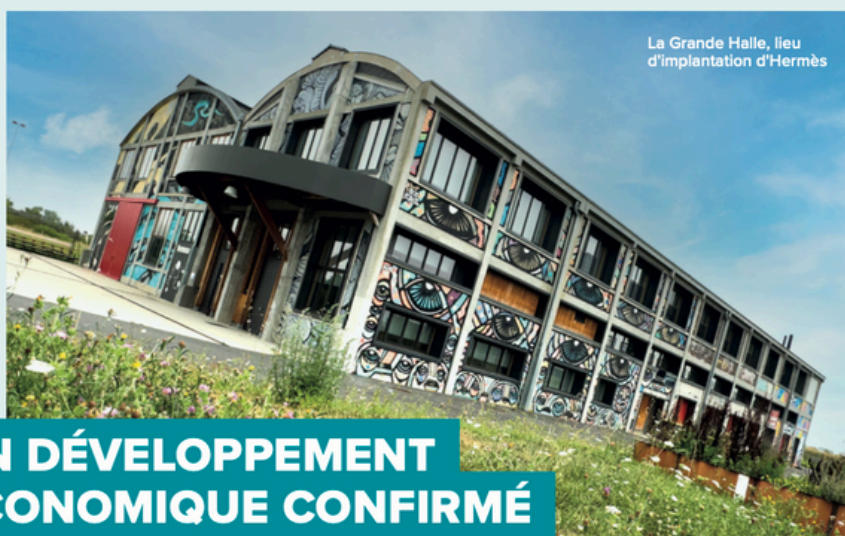
La Grande Halle, lieu d'implantation d'Hermès

Caen s'affirme, se transforme et innove. Notre ambition est claire : renforcer l'attractivité de notre territoire tout en facilitant le quotidien des Caennais.